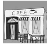
3. . . . .