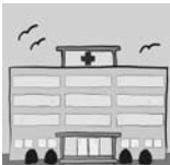
7. . . . .