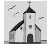
6. . . . .