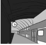
1. gară, gări