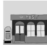
9. . . . .