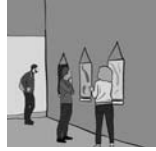
2. . . . .