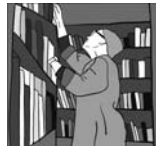
5. . . . .