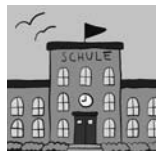
8. . . . .