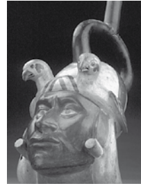
Moche: huaco retrato

blo muy guerrero, practicaban sacrificios humanos en honor a sus dioses y utilizaban el oro para adornarse con aretes, narigueras, coronas, pectorales, etc. como señales de poder.