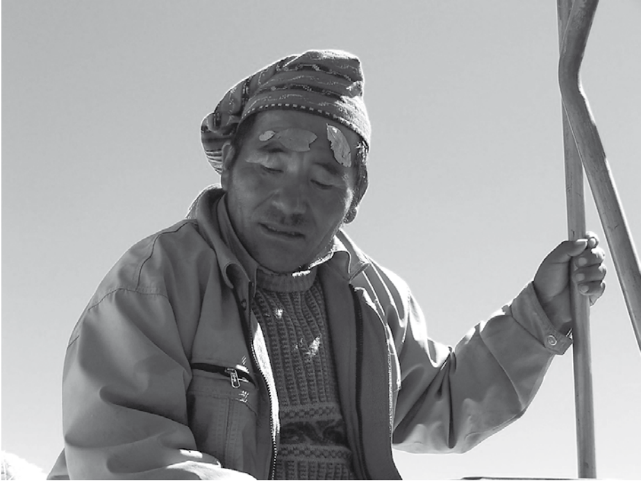
Hojas de coca contra el dolor de cabeza