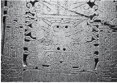
Chavín: Estela Raimondi