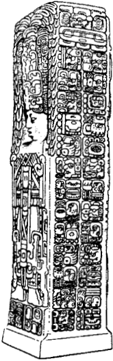
Estela maya de Quirigua (Guatemala)

mayas desarrollaron la Cuenta Larga. Como otras sociedades de Mesoamérica, los mayas consideraban que anteriormente habían existido otros mundos. Por eso fecharon la creación de su era actual en el año 3113 a.C., año en el que empezó la Cuenta Larga.