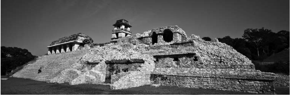
Templo de Palenque