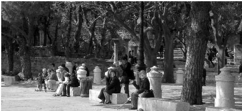
Lisboa: Ausruhen über der Stadt, direkt am Castelo de São Jorge.