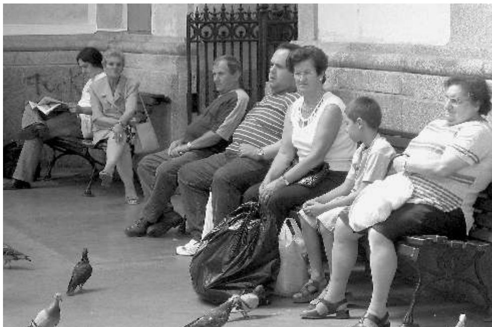
Warten auf den Zug im Hauptbahnhof São Bento in Porto