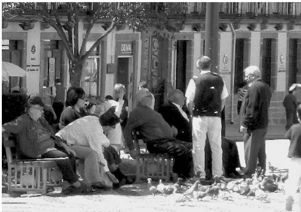
Guimarães – Plausch auf dem Marktplatz